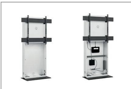
AV-Zubehör findet im Inneren problemlos Platz